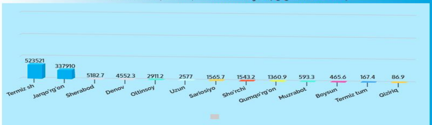
2018 yilda xududlar bo'yicha o'z kuchi bilan ishlab chiqarilgan innovatsion mahsulotlar, ishlar, xizmatlar hajmi(QQS va aktsisiz)

Viloyatda jami korxonalar o'z kuchi bilan ishlab chiqarilgan innovatsion mahsulotlar, ishlar, xizmatlar hajmi 2018yilda (birinchi marta) 107149,1mln. so'mni tashkil qilgan bo'lsa kichik korxonalarda . 107149,1mln so'mni tashkil qilmoqda.