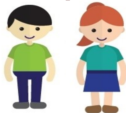
Surxondaryo viloyati bo'yicha tug'ilganlar soni (2019-2020-yil yanvar-sentyabr oylari)

Tug'ilish koeffitsiyenti 2019- yilning mos davriga nisbatan jumladan; Termiz shahrida (25,0 promilledan 30,3 promillega), Oltinsoy (27,2 promilledan 28,8 promilega), Sariosiyo (25,3 promilledan 26,4 promillega) kuzatildi.